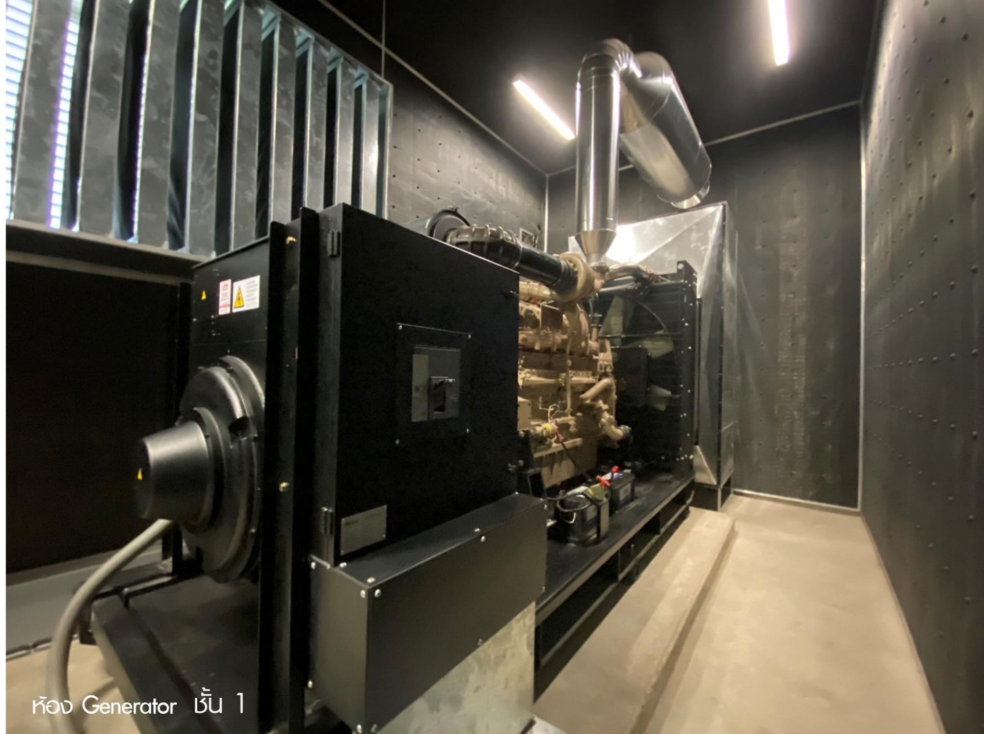
ห้อง Generator ชั้น 1