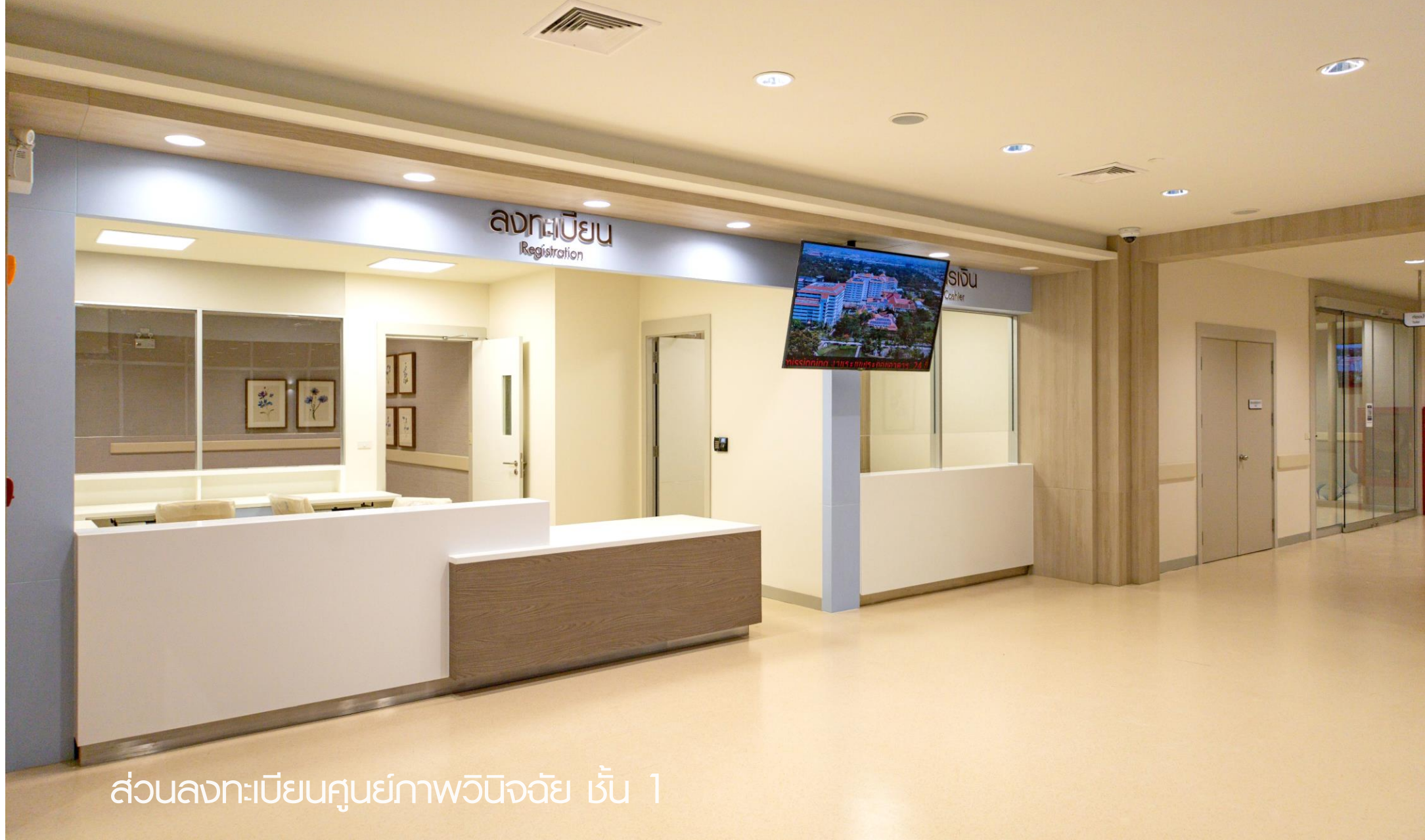
ส่วนลงทะเบียนศูนย์ภาพวินิจฉัย ชั้น 1