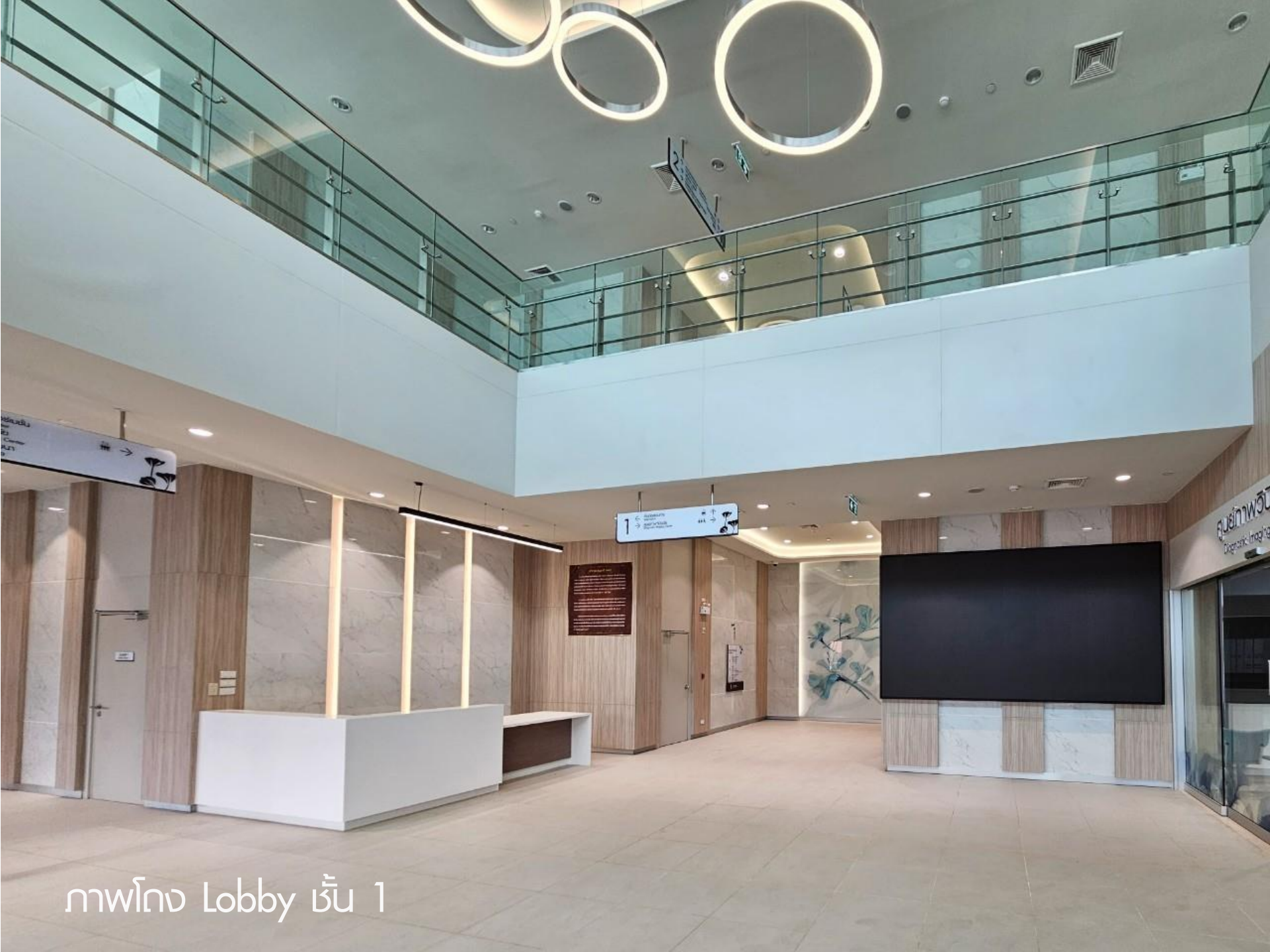
1 ชั้น Lobby ศาลา