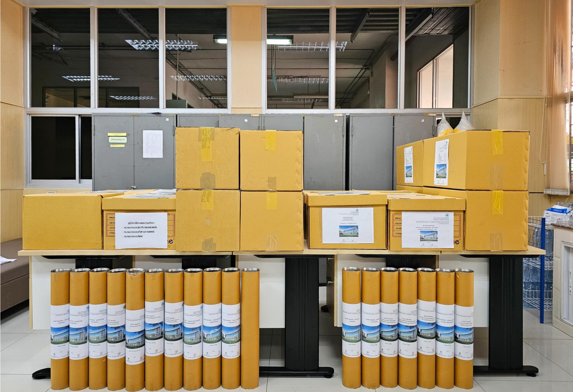
เอกสารส่งมอบที่อาคารบริการ ชั้น 1