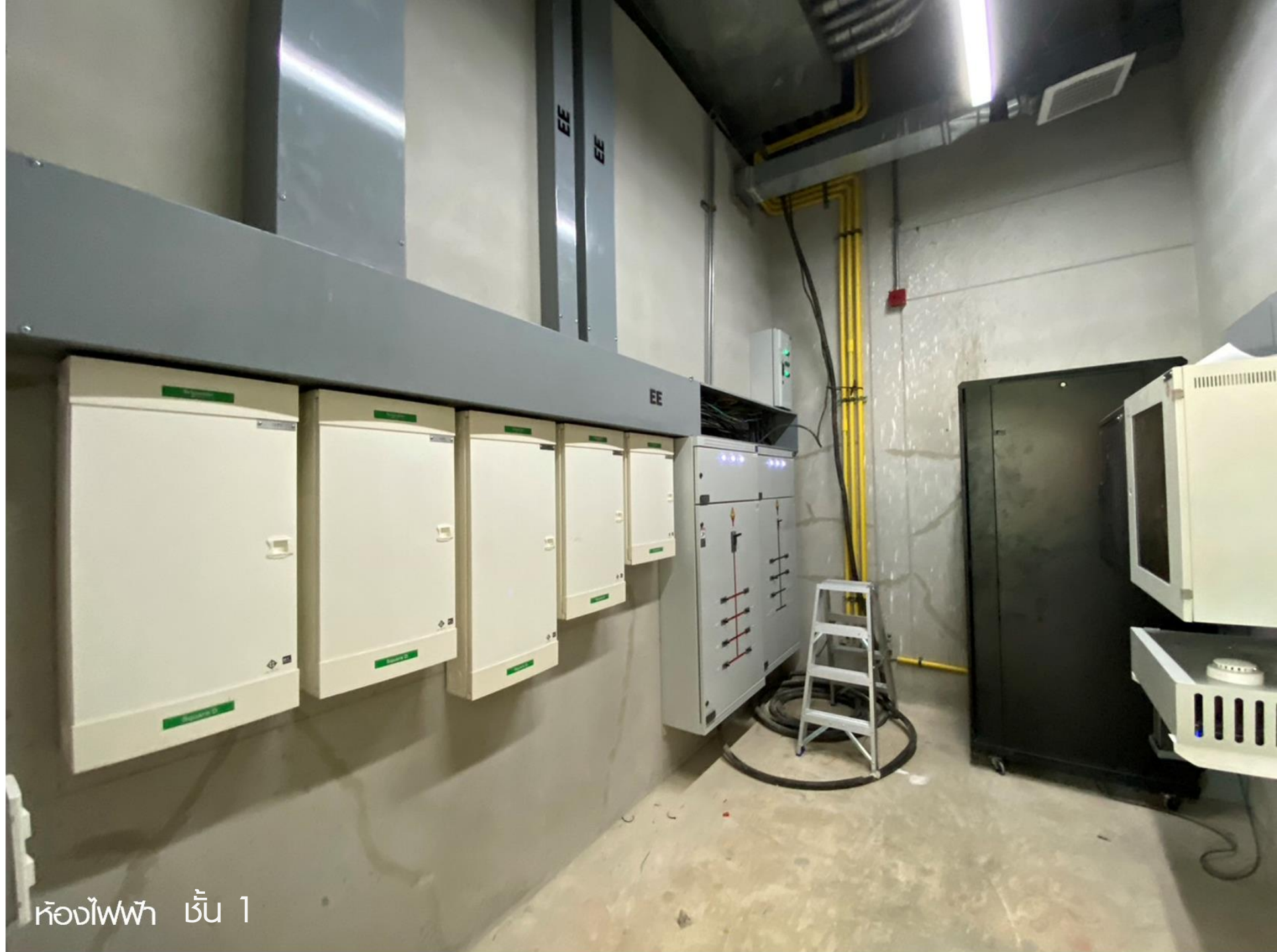
ห้องไฟฟ้า ชั้น 1