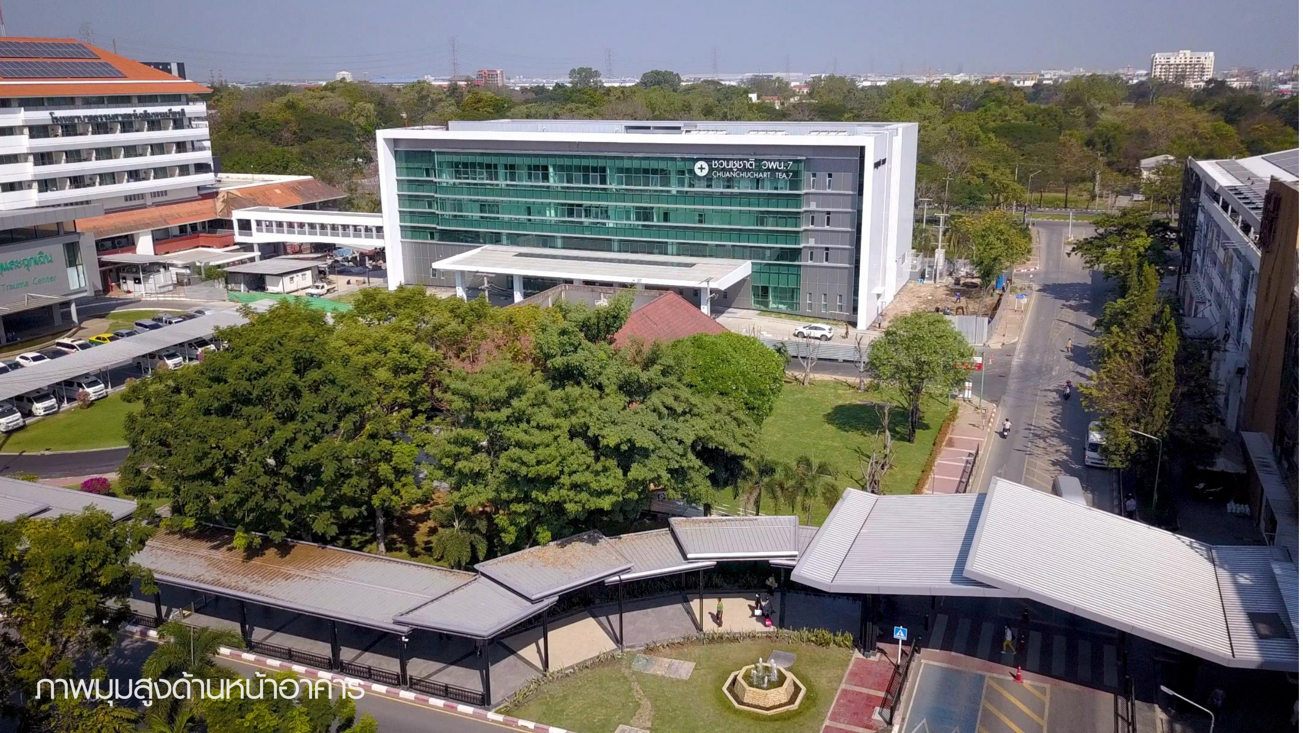
ภาพมุมสูงด้านหน้าอาคาร