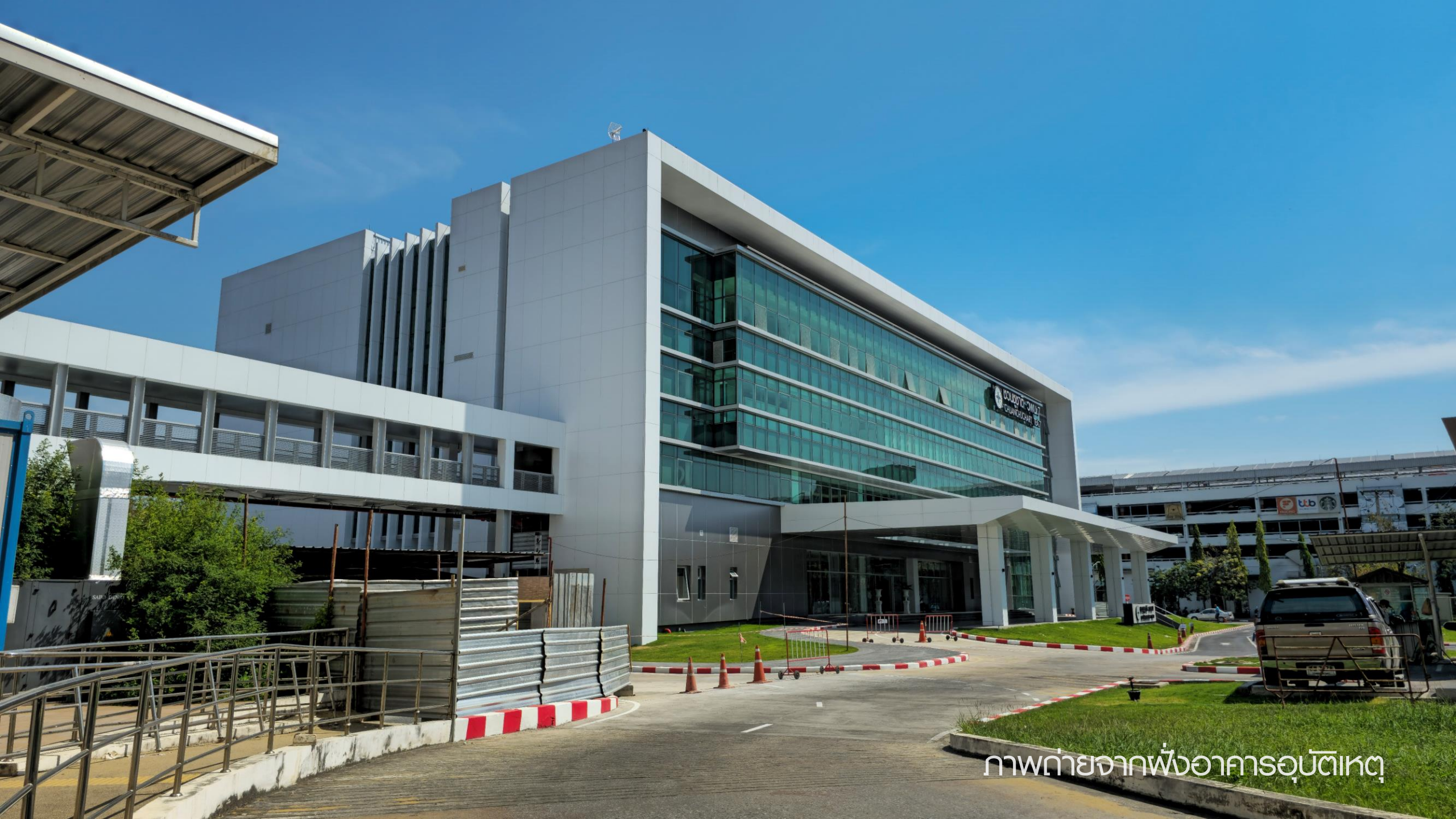
ภาพถ่ายจากฟังก์ชันอาคารอุบัติเหตุ