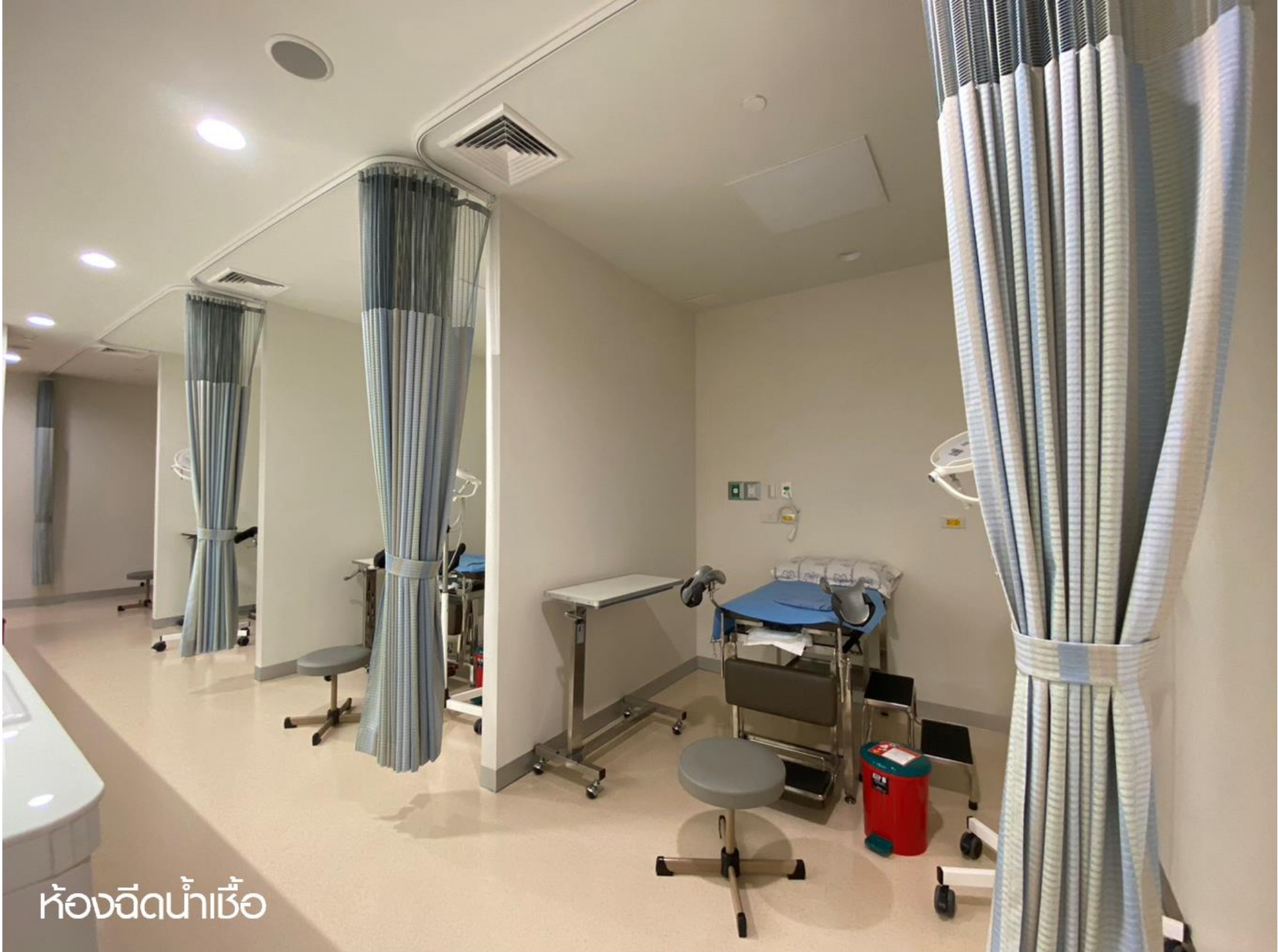
ห้องฉีดน้ำเชื้อ