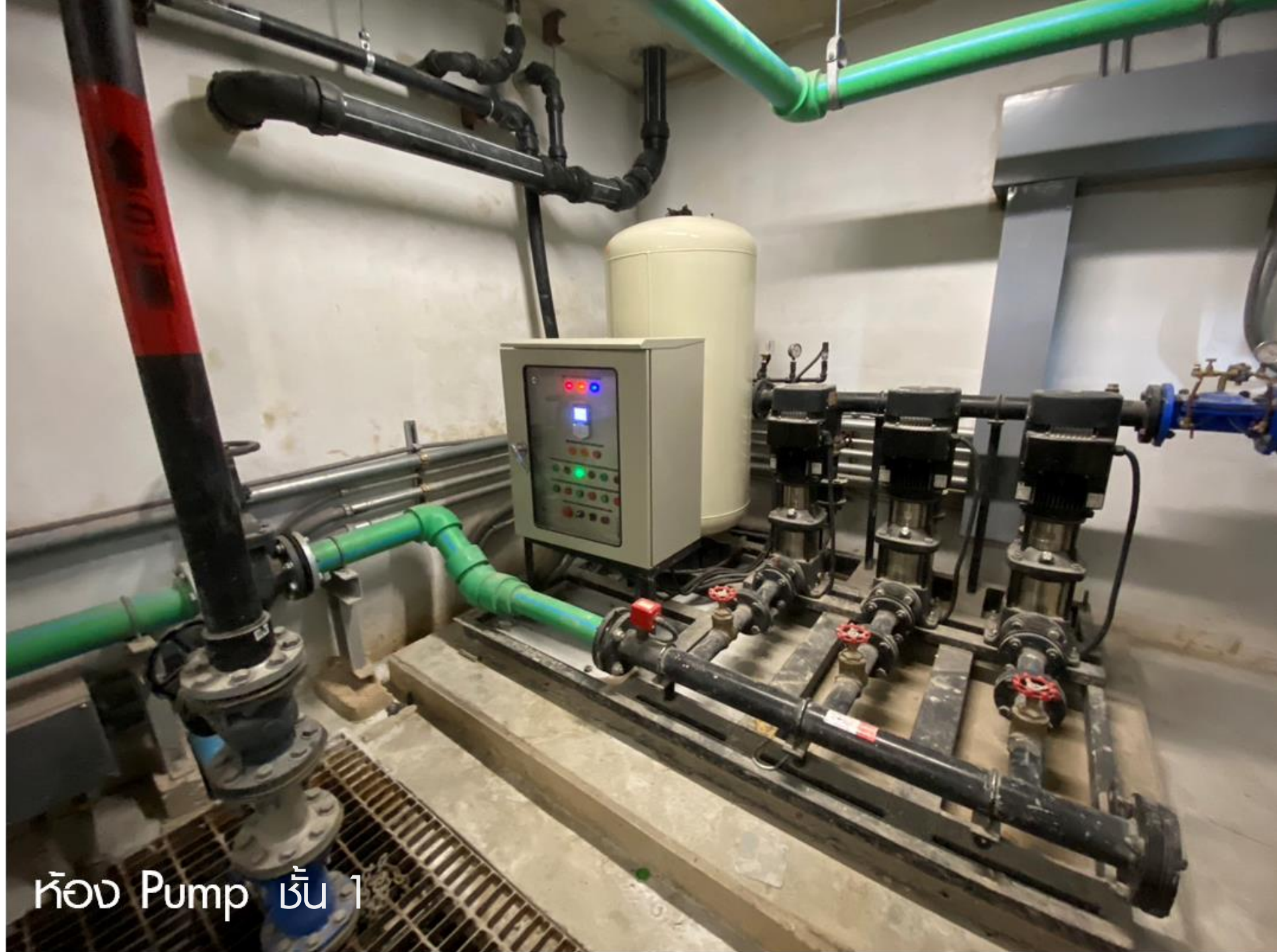
ห้อง Pump ชั้น 1