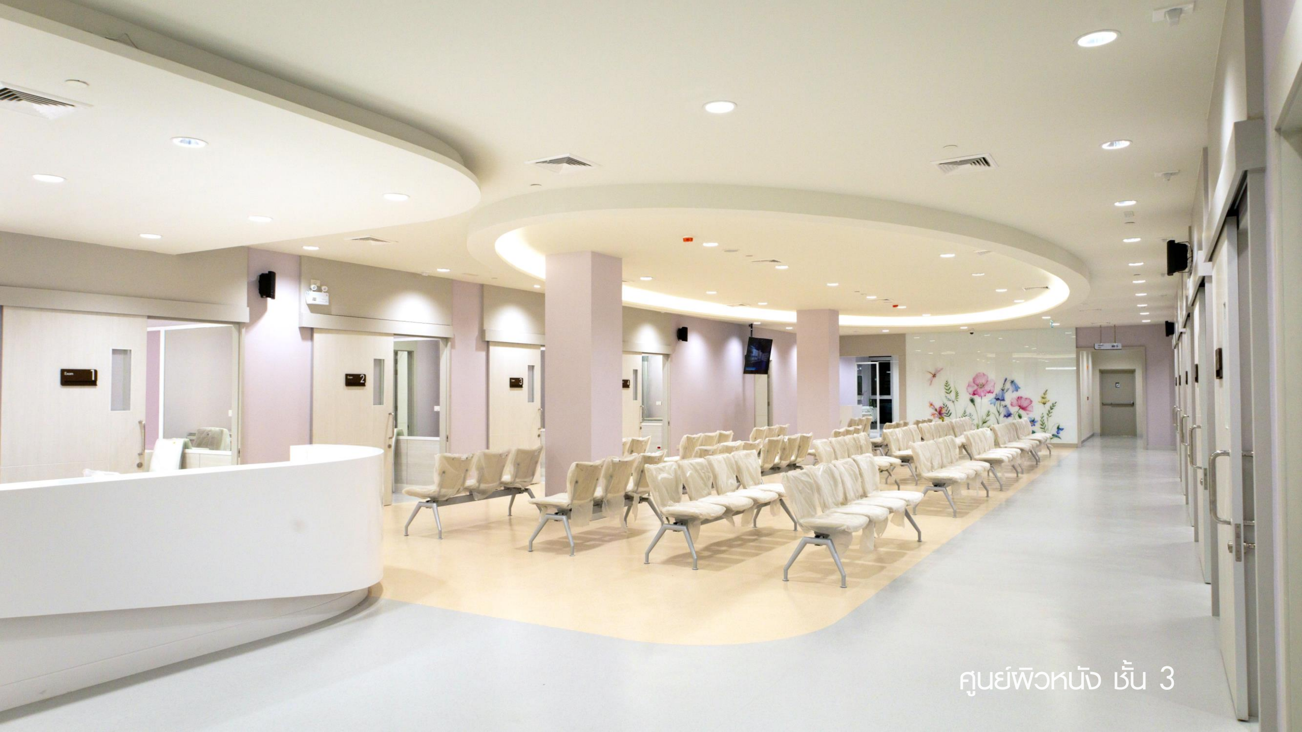
ศูนย์พิวหนัง ชั้น 3