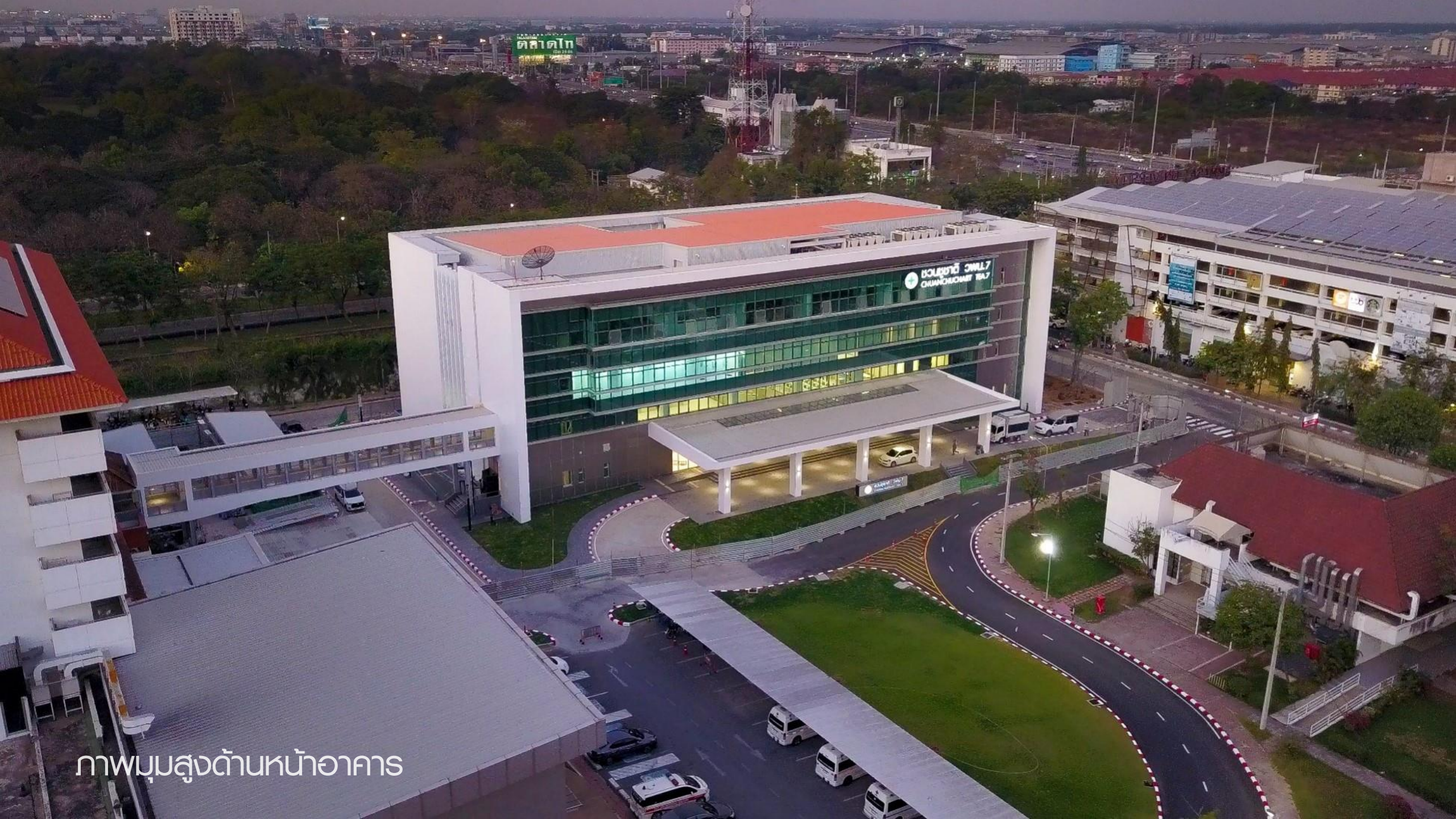
ภาพมุมสูงด้านหน้าอาคาร