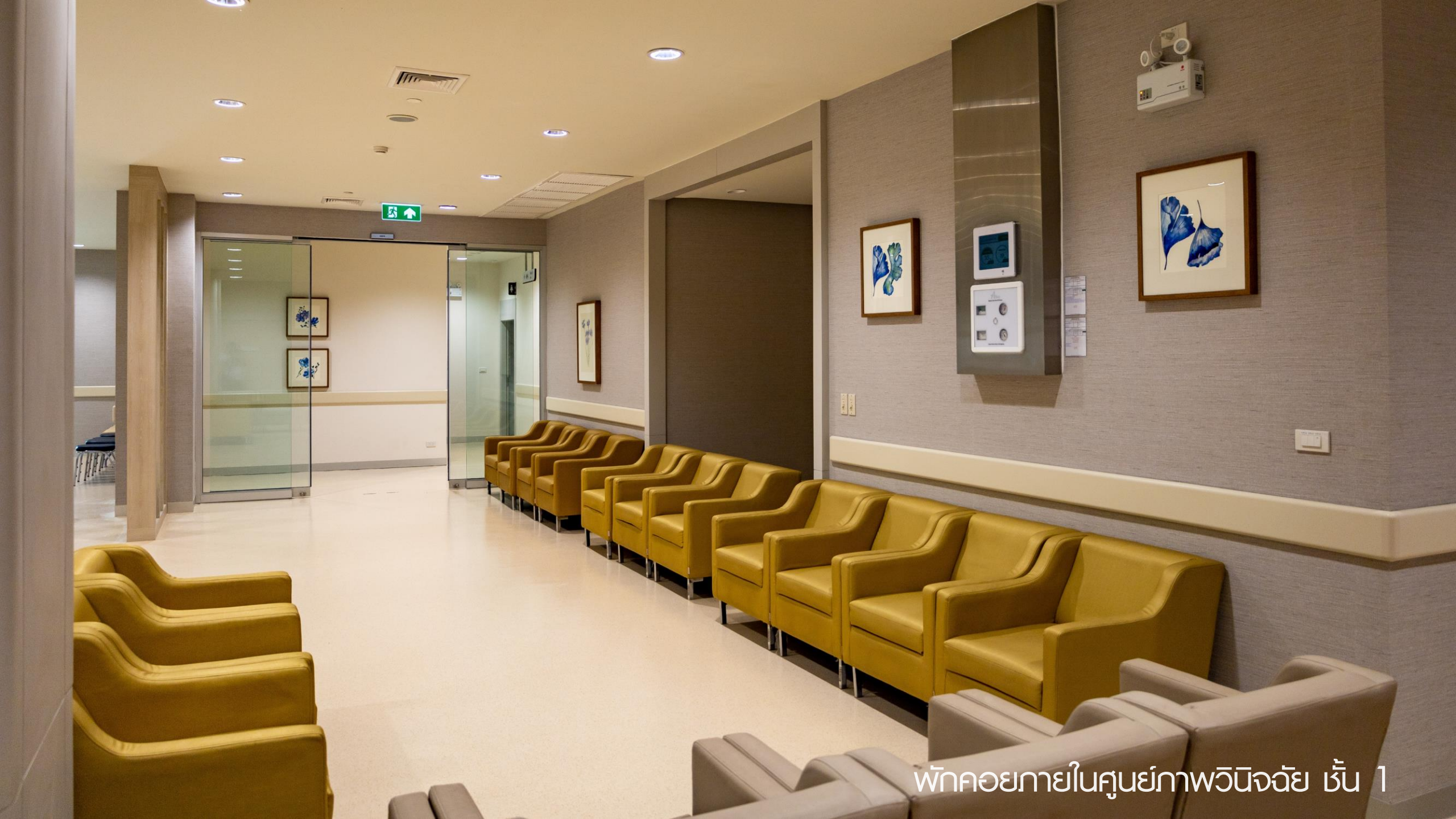
พักผ่อนภายในศูนย์ภาพวินิจฉัย ชั้น 1