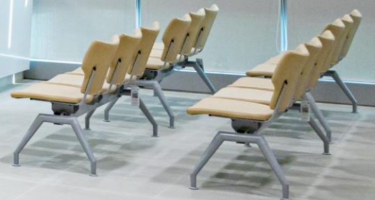
ศูนย์ผิวหนัง ชั้น 3