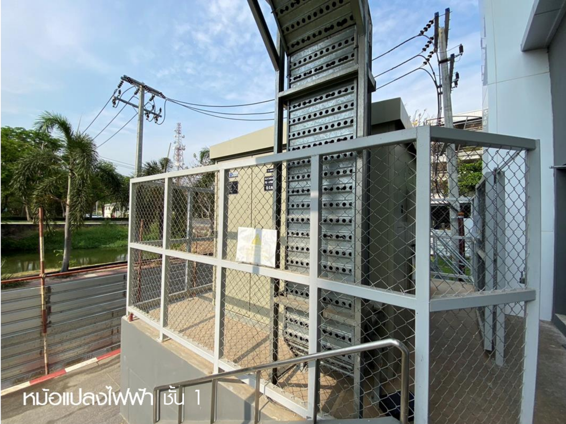
หม้อแปลงไฟฟ้า ชั้น 1