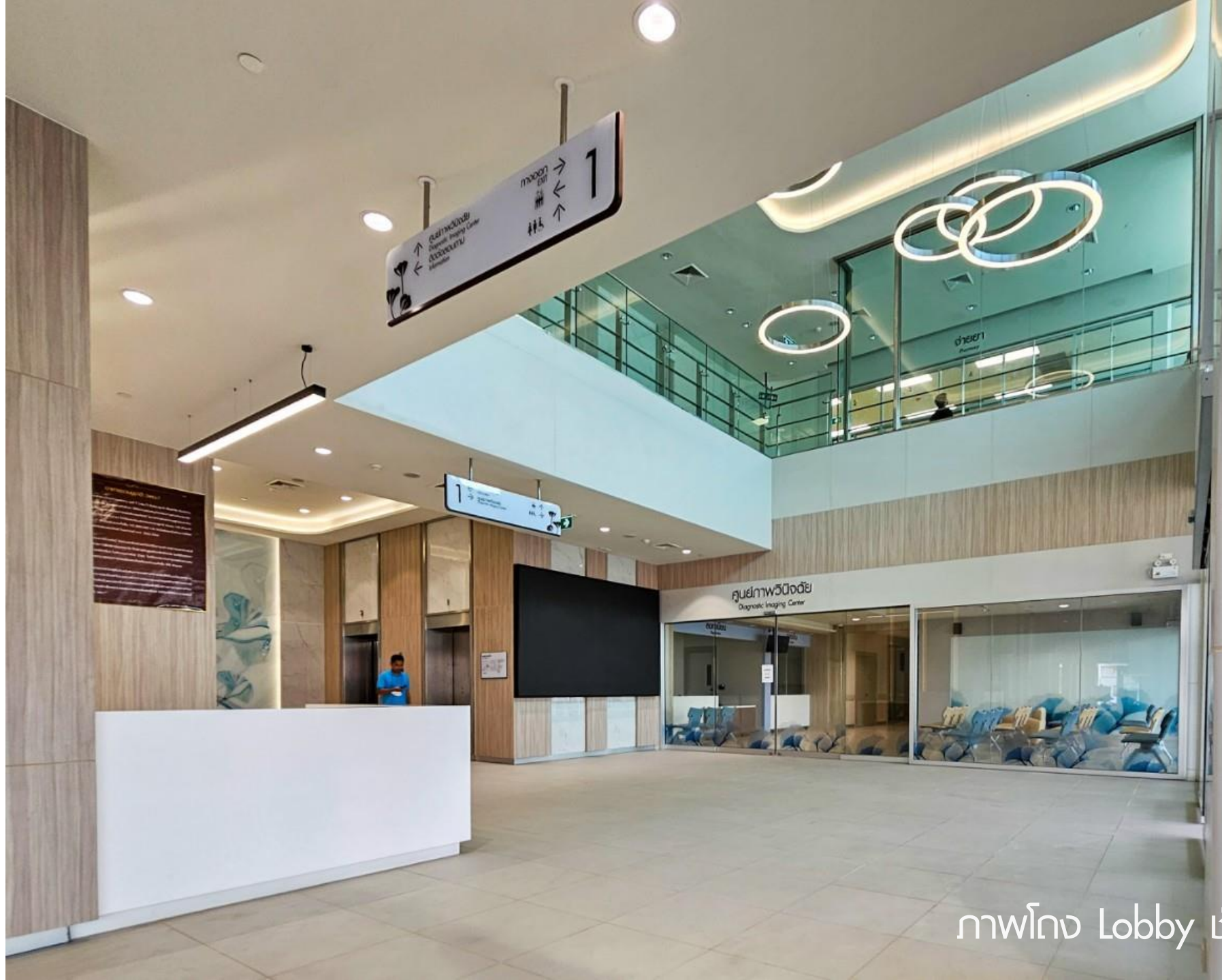
ภาพ Lobby ชั้น 1