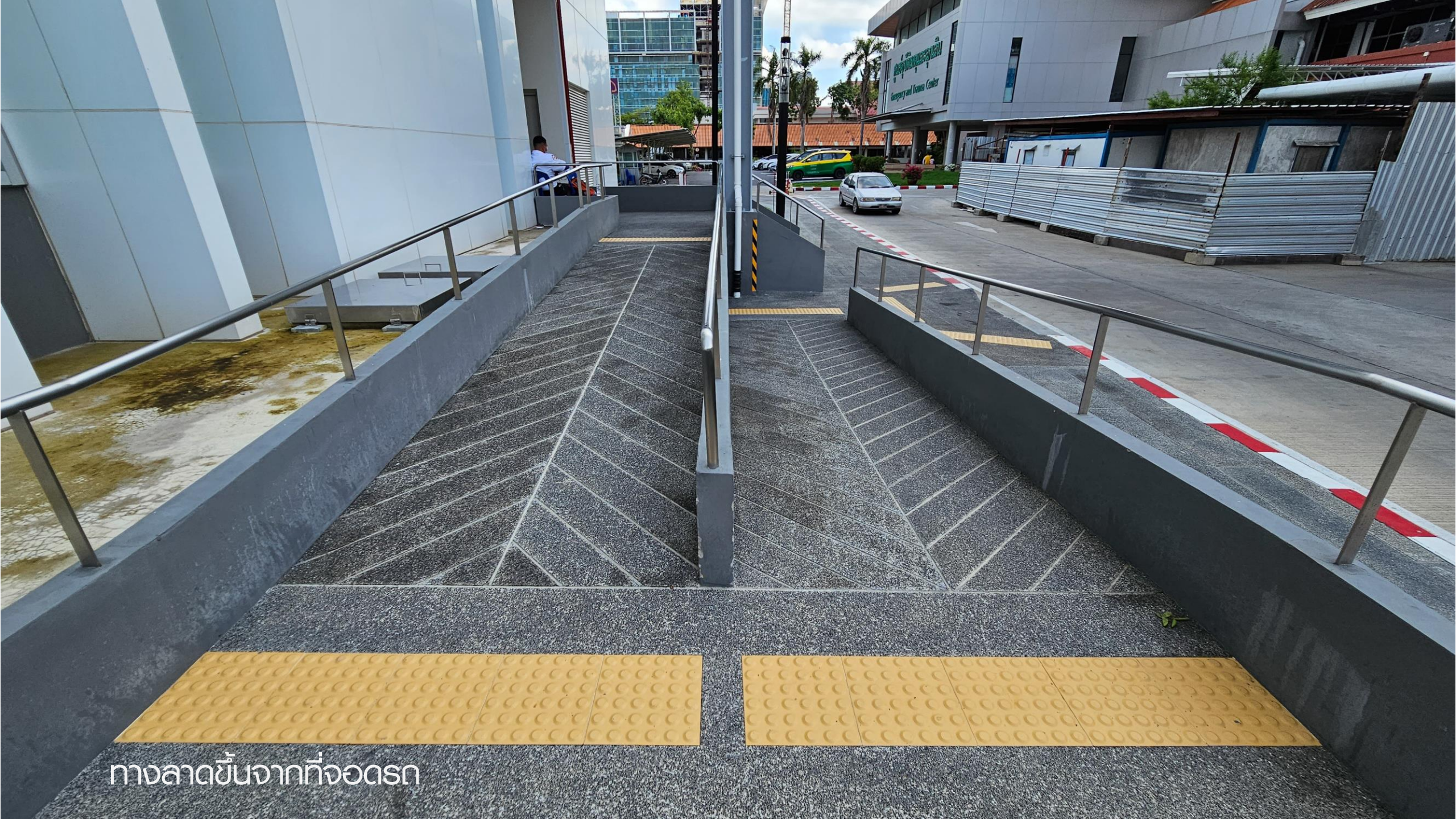
ทางลาดขึ้นจากที่จอดรถ