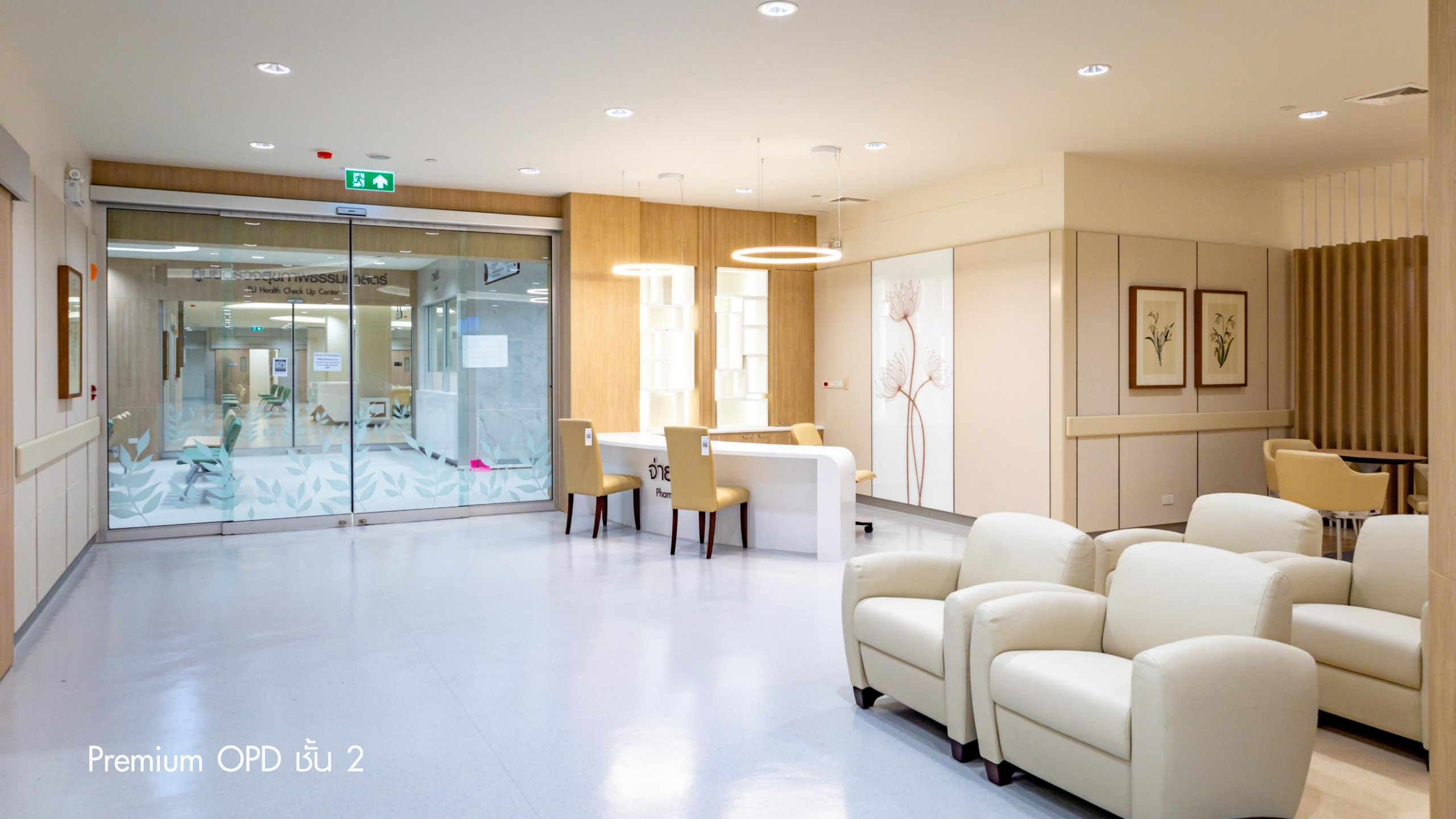
Premium OPD ชั้น 2