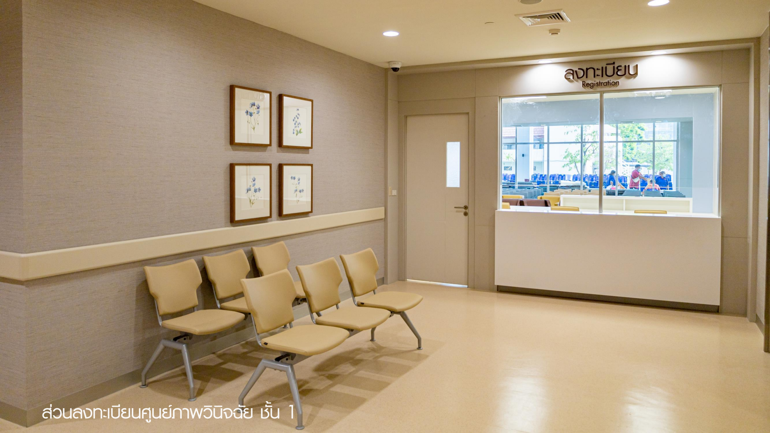
ส่วนลงทะเบียนศูนย์ภาพวินิจฉัย ชั้น 1