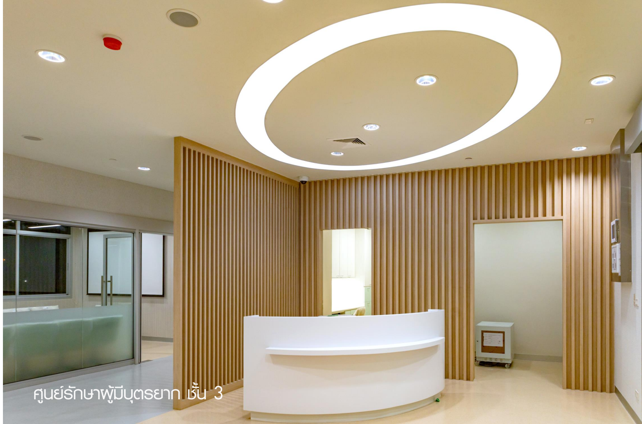
ศูนย์รักษาผู้มีบุตรยาก ชั้น 3