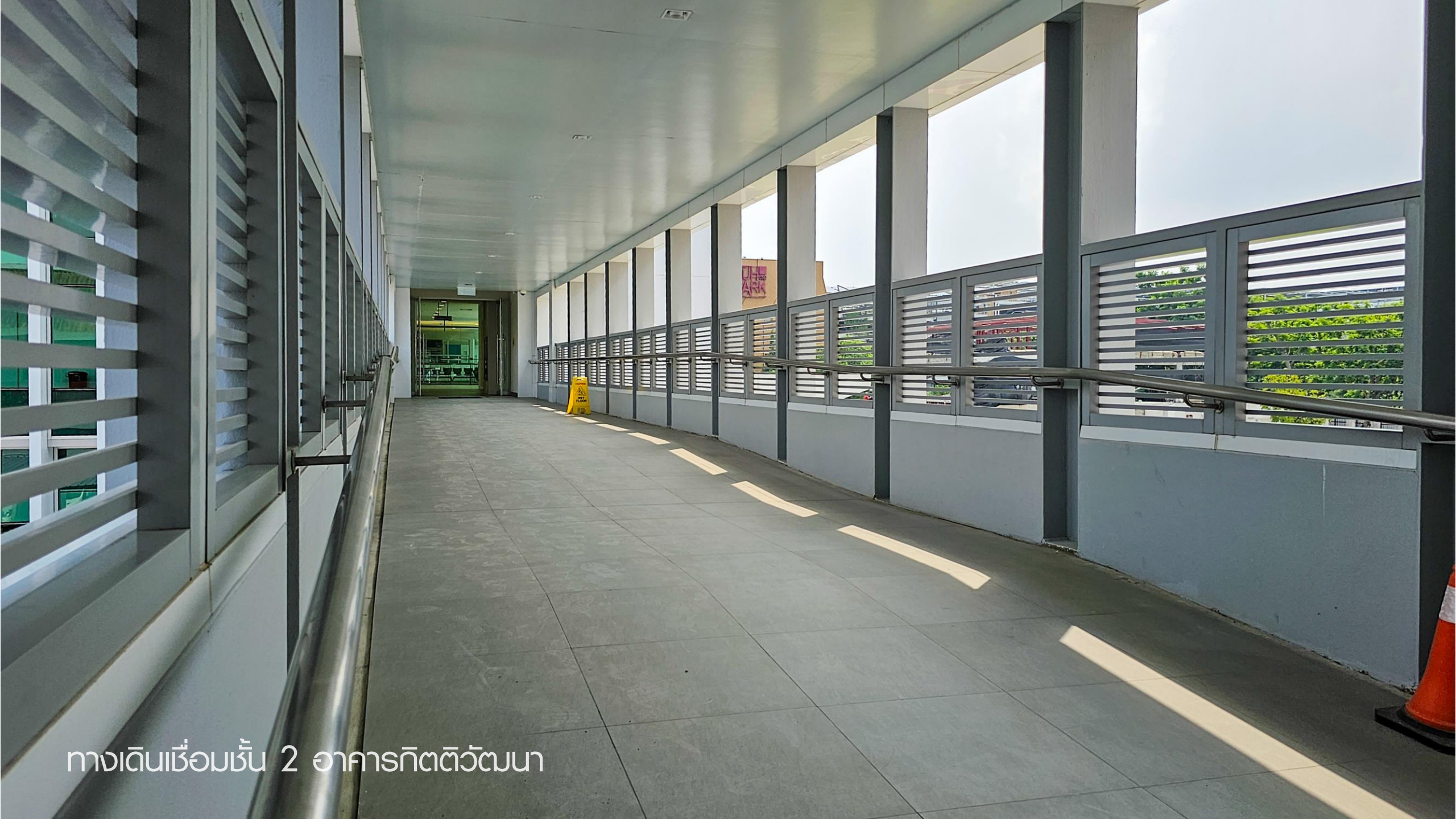
ทางเดินเชื่อมชั้น 2 อาคารกิตติวัฒนา