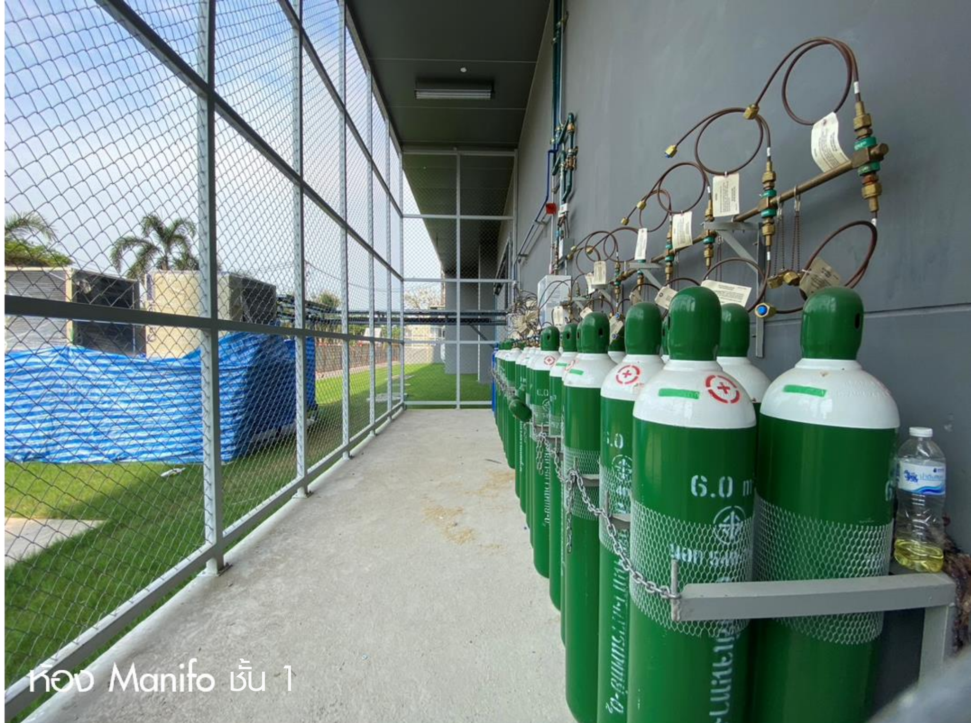
ห้อง Manifo ชั้น 1