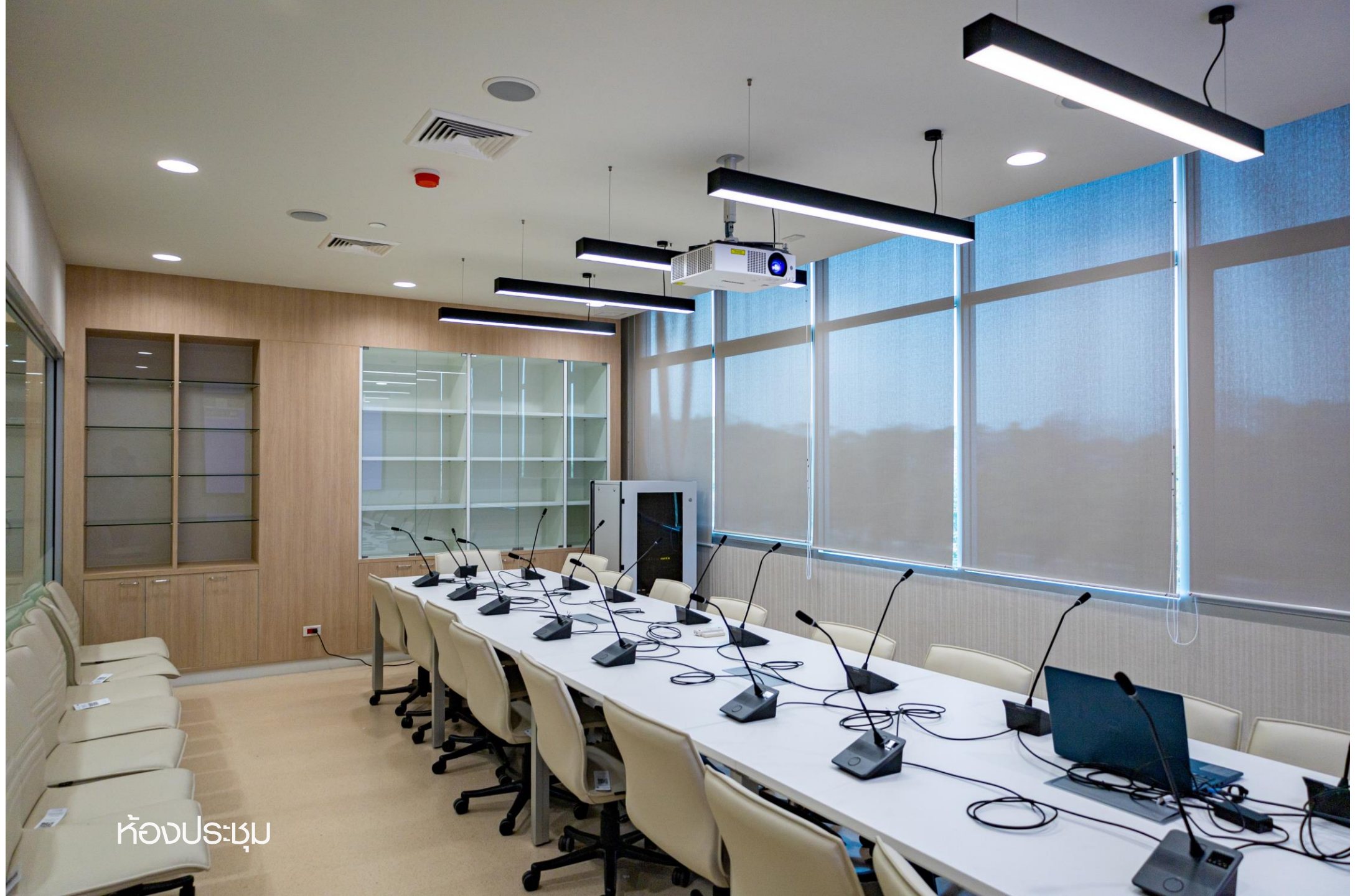
ห้องประชุม